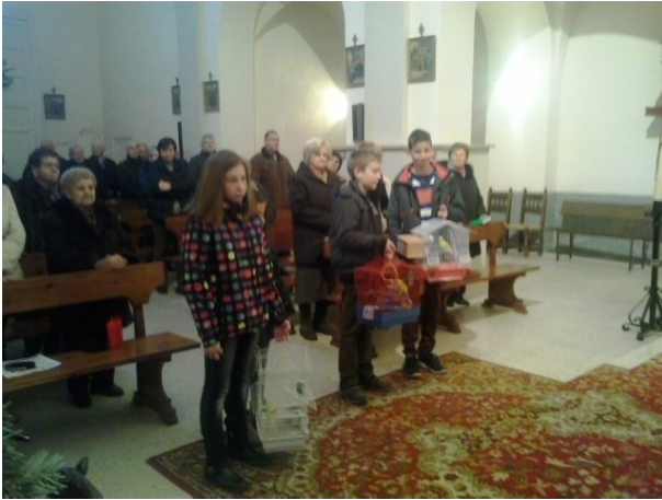
S. Anton: Los niños llevan sus mascotas a vendecir