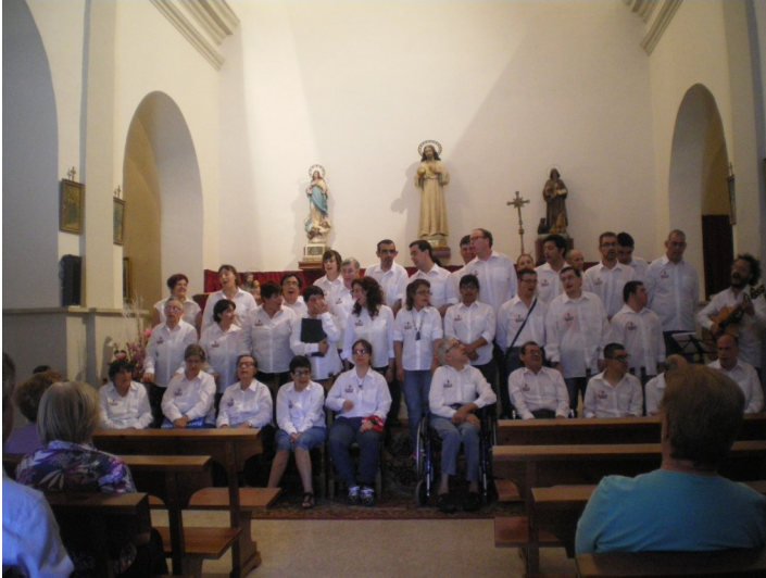
Concierto a cargo del “Coro Atades”, para celebrar el 25º aniversario de las Jornadas Culturales.