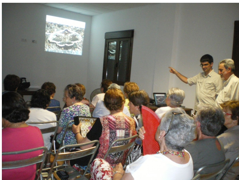
Charla con proyección "Mariposas del somontano y el sobrarbe" por Sergio Bestue.