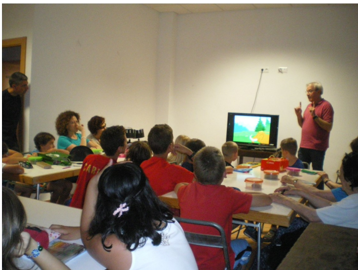
Taller de animación; “¿Te gustaría conocer la historia de Aragón?”, por Jorge Gastón.