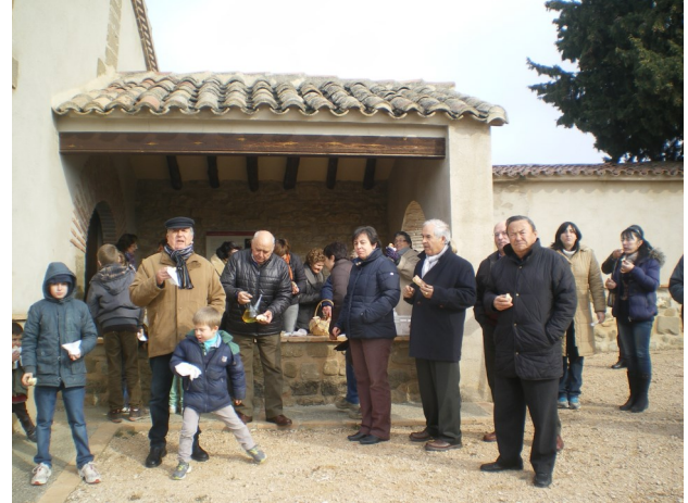
Reparto de torta bendecida en San Fabián.