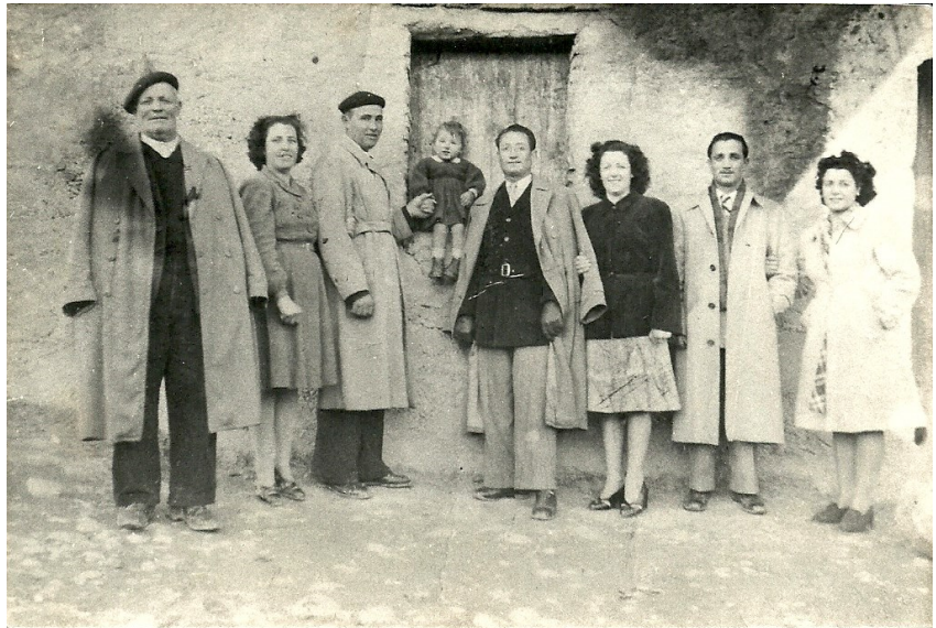
Familia Cebollero, finales de los 40.

En ese mismo lugar existió un castillo denominado Castillo Cebollero que según algún autor se denominó así por la abundancia de la planta herbácea (cebolla). Y se tienen algunas referencias, como que sirvió de límite para repartir la herencia del rey Jaime I el Conquistador a su primogénito Don Alonso nacido del primer matrimonio con su esposa la reina Leonor (Libro III Capítulo XLIII Anales de la Historia de Aragón).